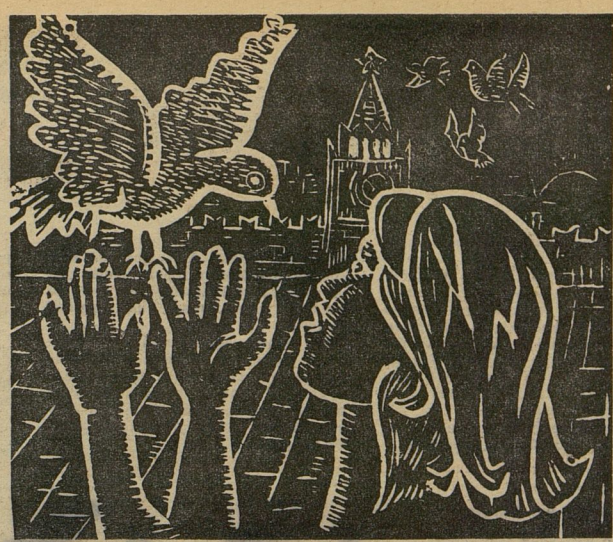
«ГОЛУБЬ МИРА». Литографера Серёжи Котрикова. Станица Новотитаровская, Краснодарский край.